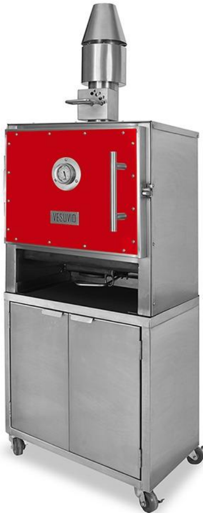
Modelo BAMBINO 50 con gabinete standard y ruedas