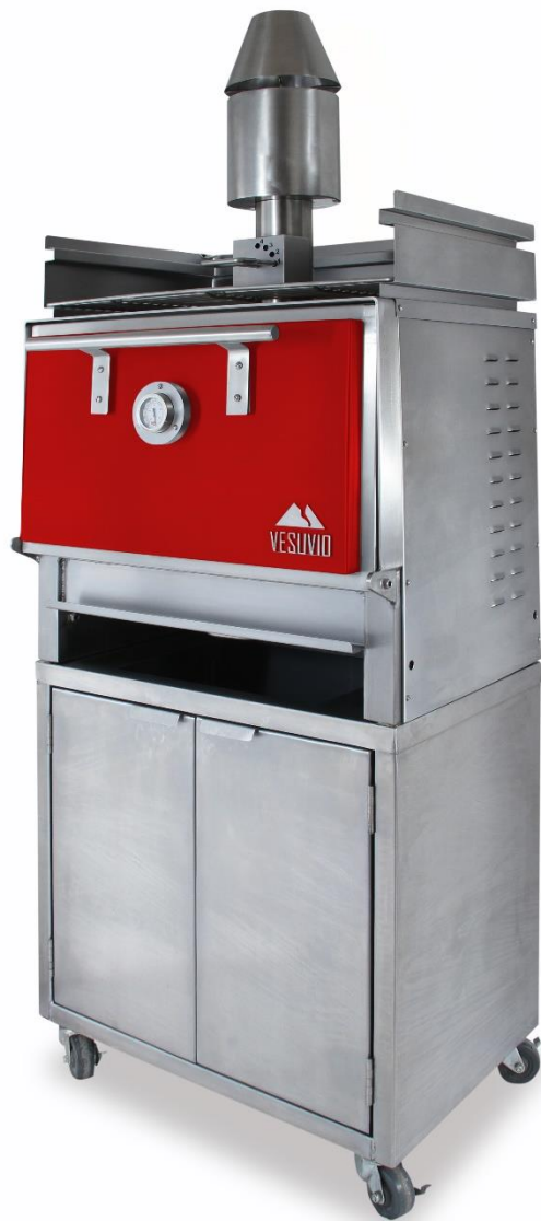
Modelo PICCOLO, con gabinete standard y ruedas